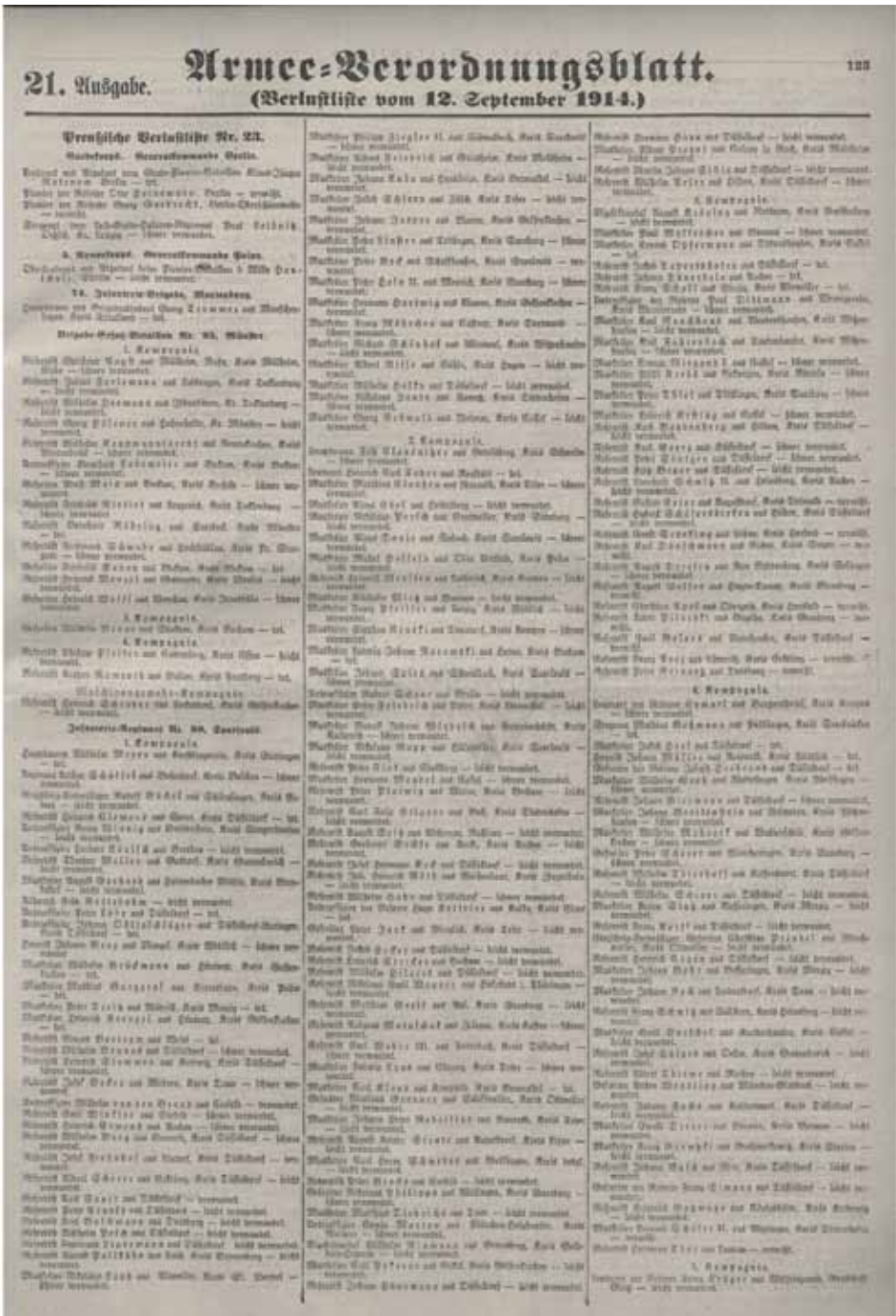
Fot.6. Listy strat – przykładowa strona z początkowego okresu publikowania list strat „Lista pruska nr 23 / Ausgabe 21 / strona 123 / z dnia 12.09.1914 r.”