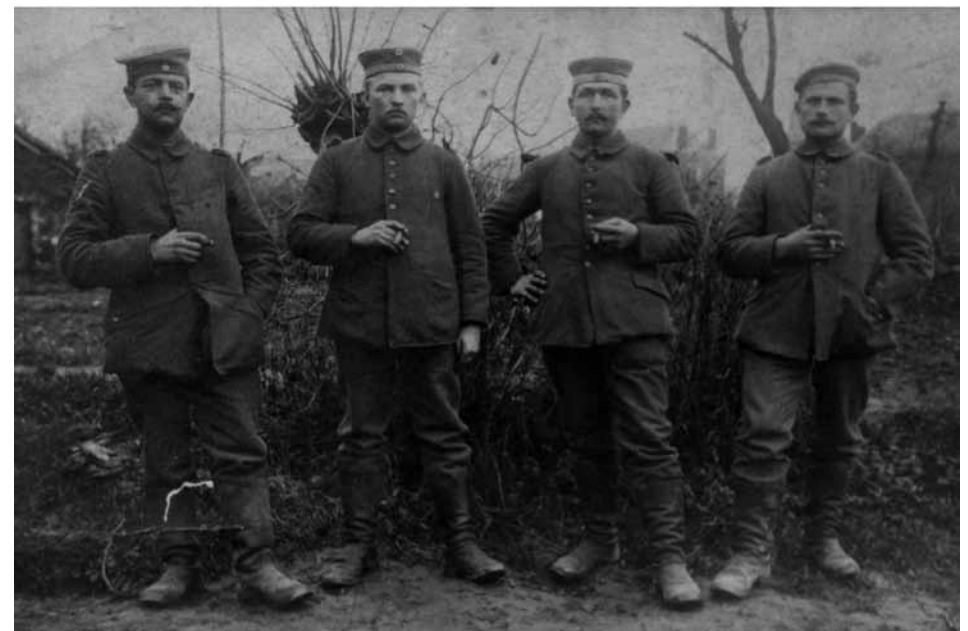
Fot.20 Nieustaleni żołnierze.