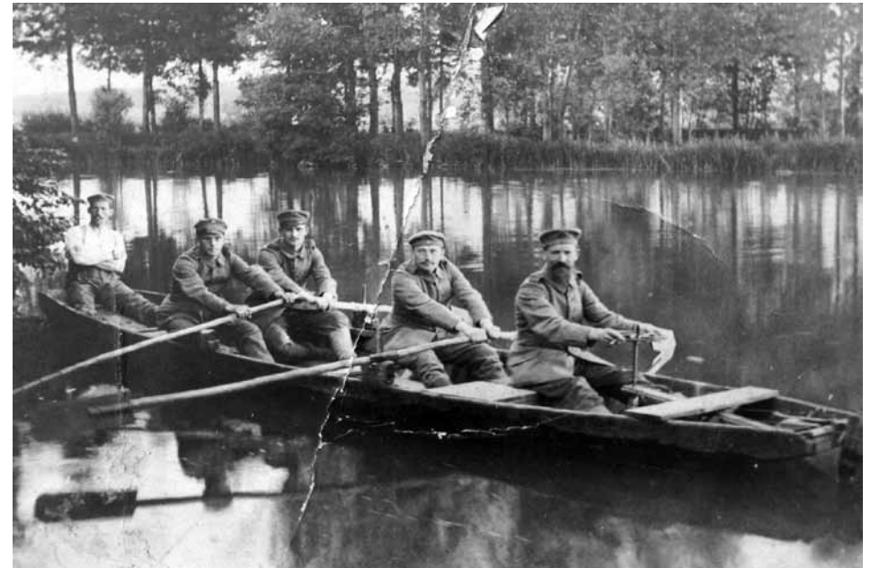
Fot.19. Nieustaleni żołnierze.